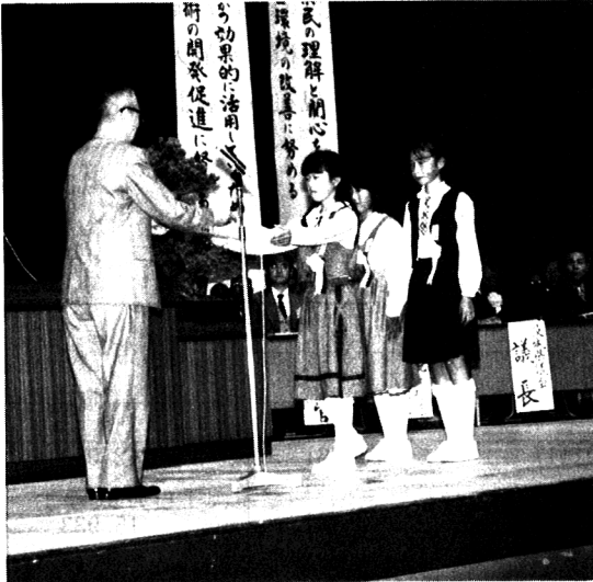
統計グラフコンクール入賞者表彰