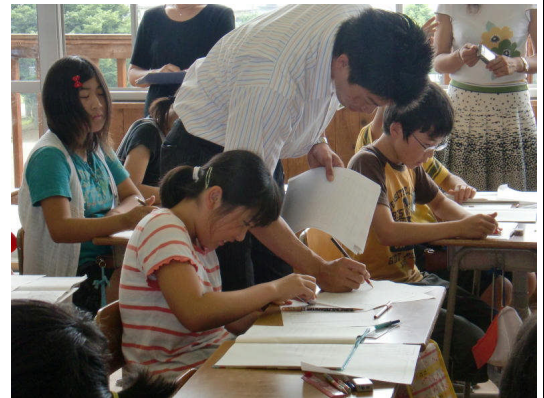
机間指導で○をつける