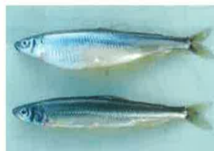
ワカサギ親魚 （上:メス 下:オス）