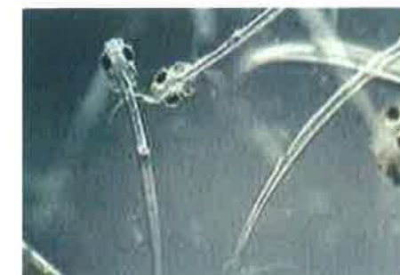
ワカサギのふ化稚魚 （体長約5mm）