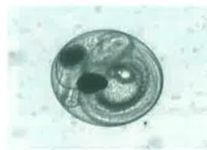
ふ化直前のワカサギの卵 （直径約1mm）