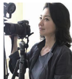
織作 峰子 大阪芸術大学教授 写真家