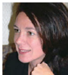
あんまくだなり 上智大学大学院教授 慶応義塾大学特任教授