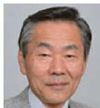
林 良博 国立科学博物館館長