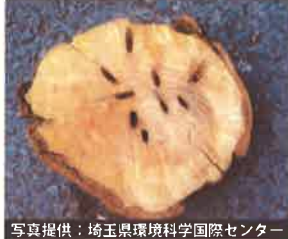
幼虫に食害された樹木の内部

サクラやウメ・モモの他にも様々な樹種を食害するため、生態系にも影響をおよぼすおそれがあります。