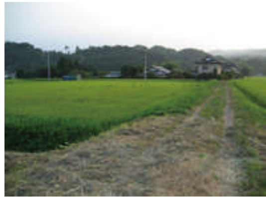
○1人当たりの管理距離が長い農道