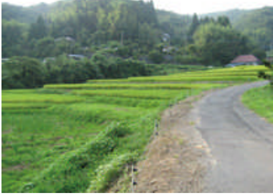
○美しい棚田景観の維持