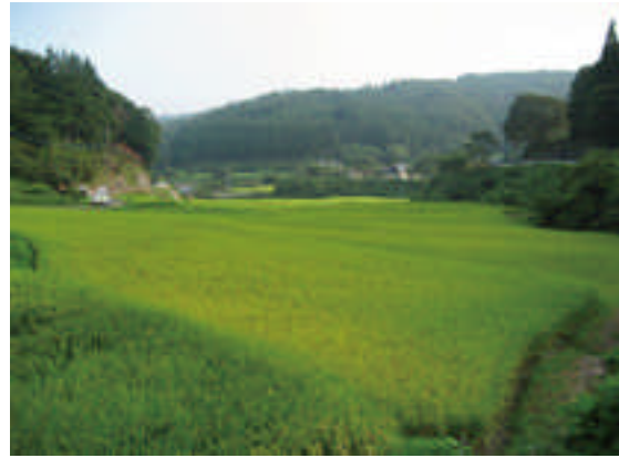
○よく管理された農地法面