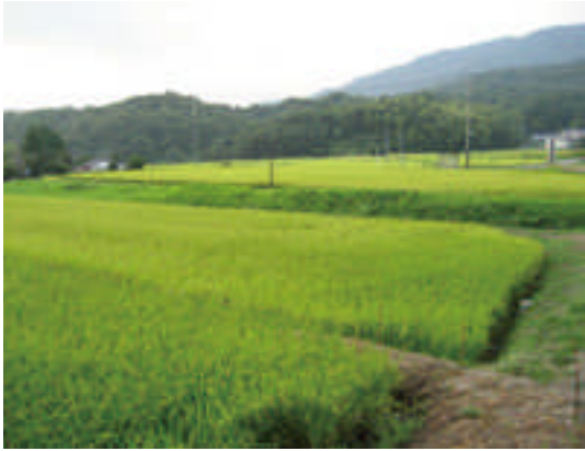
○きれいに整備された棚田