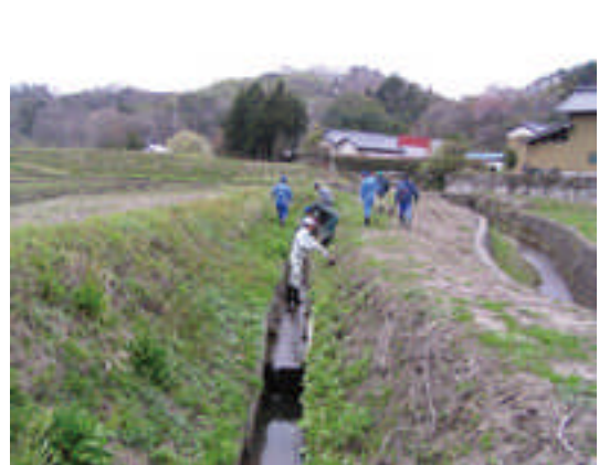
○共同活動での水路の管理の様子