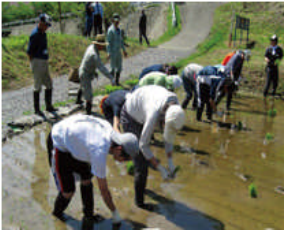
○早稲田塾農業体験の様子