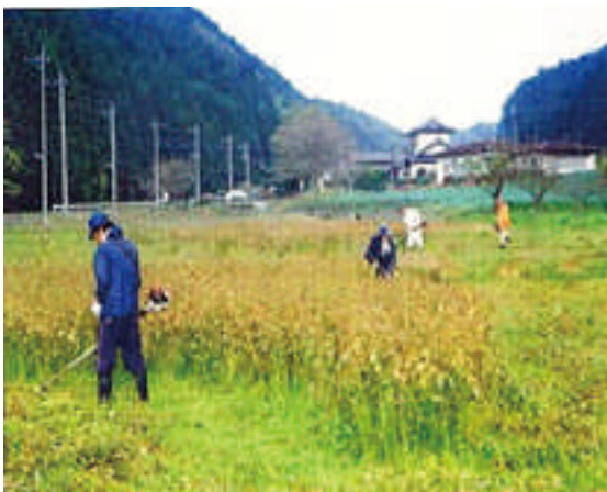
○ソバの刈り取りの様子