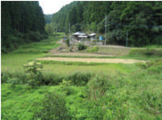
○集落の貴重な財産となっている農村風景