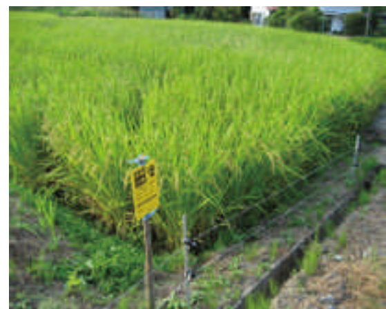
○集落のほぼ全体を囲む電気柵の設置