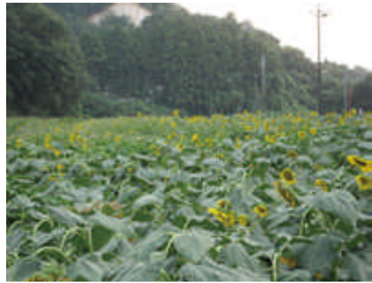
○景観作物として作付けされたヒマワリ畑