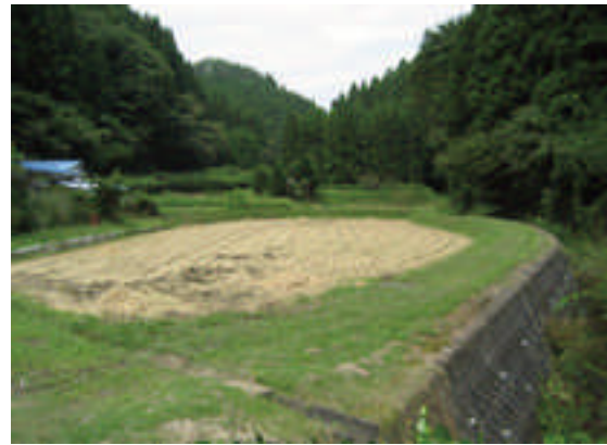
○適切に管理された農地周辺