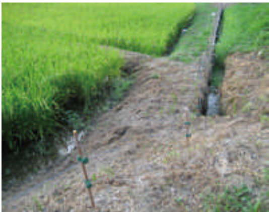
○協定農用地周りに設置された電気柵