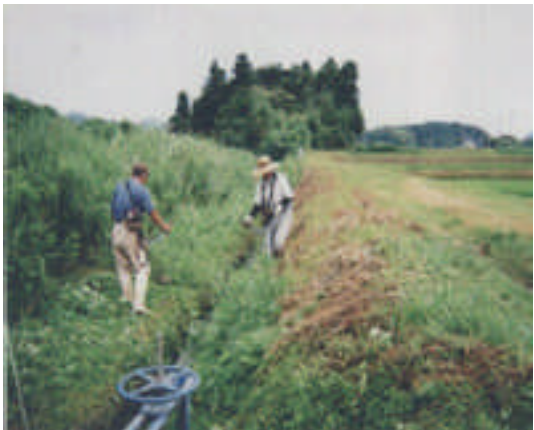
○水門ゲート・水路付近の草刈りの様子