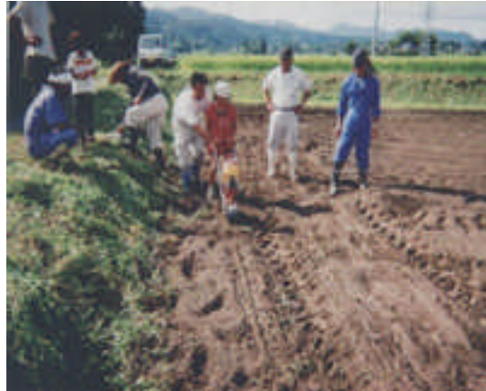
○子供会と連携し親子で実施したソバ播種