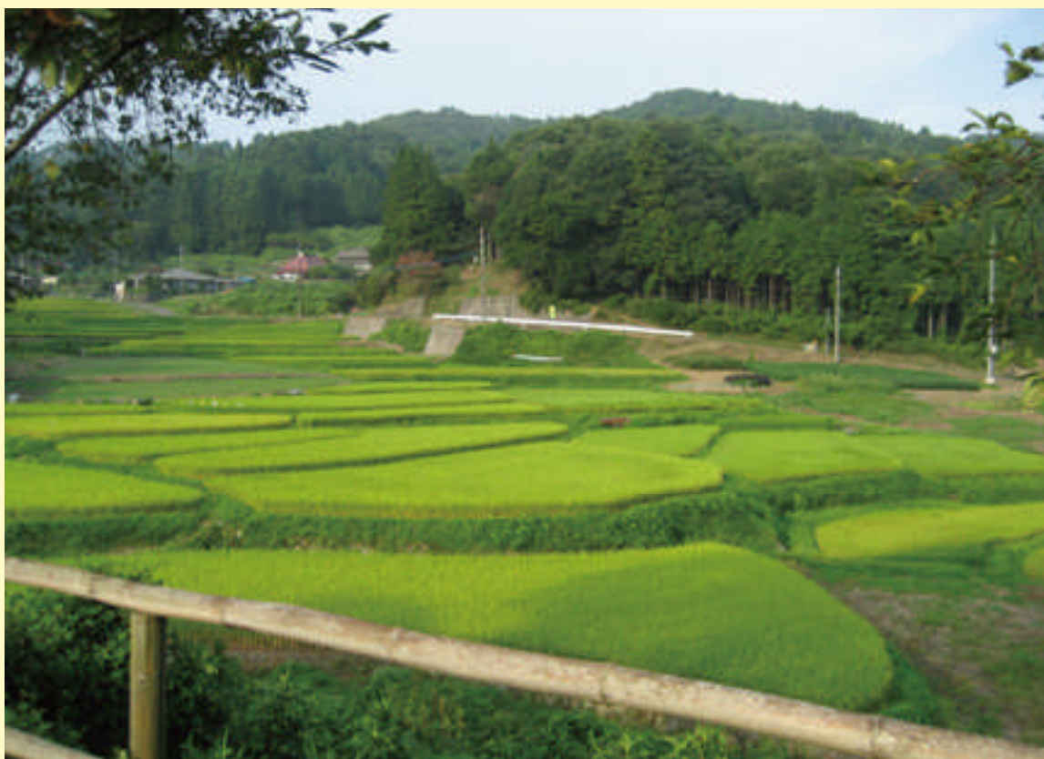
にしごうとなか 西河内中集落（常陸太田市）