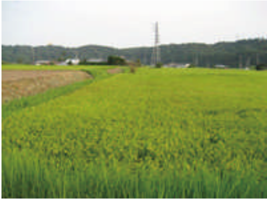
○よく手入れされた農地法面