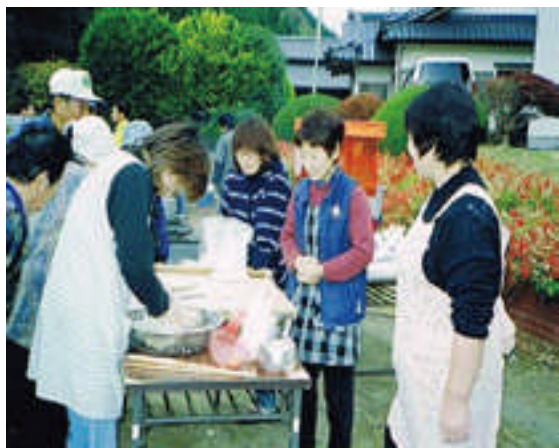
○公民館でのソバ打ち講習会の様子