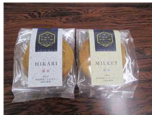
2種類の米で作った煎餅 右:コシヒカリ、 左:ミルキークイーン