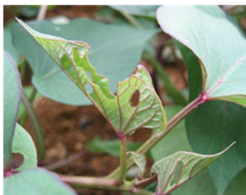
写真1 ナカジロシタバによる初期被害