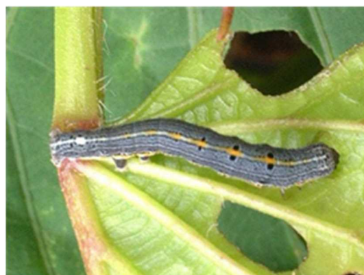
写真2 ナカジロシタバ中齢幼虫