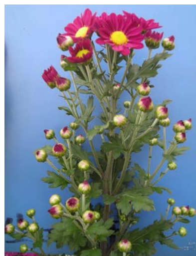
「常陸オータムゆうひ」の草姿

<問い合わせ先: 生物工学研究所果樹花き育種研究室 Tel 0299(45)8331 園芸研究所花き研究室 Tel 0299(45)8341 >