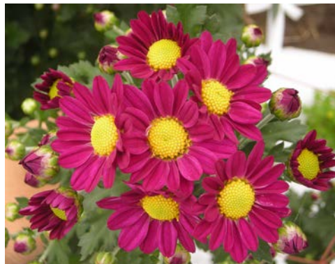
「常陸オータムゆうひ」の開花状況