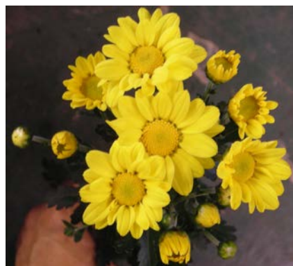
「常陸サマースター」の開花状況