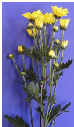
「常陸サマースター」の草姿

<問い合わせ先: 生物学研究所果樹花き育種研究室 Tel 0299(45)8331 園芸研究所花き研究室 Tel 0299(45)8341 >