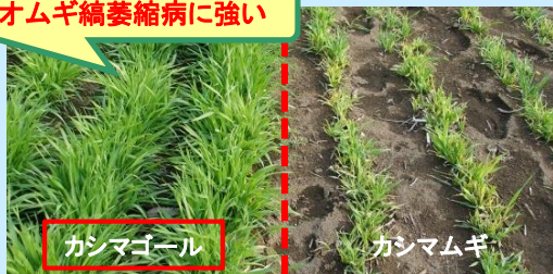
オオムギ縮萎縮病発生圃場における生育状況