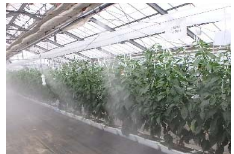
ミスト噴霧の様子