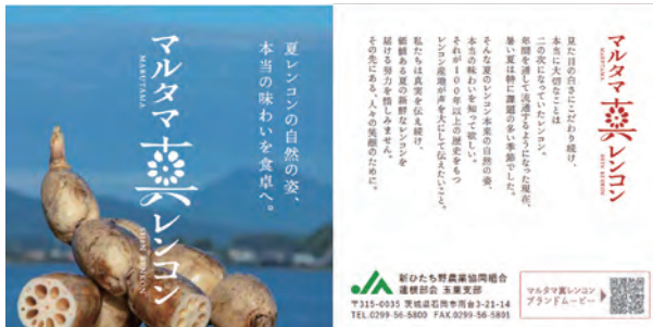
図2 新ブランドのロゴ「マルタマ真レンコン」、そのブランドのステイトメント

経営・普及部門では、園芸研究所流通加工研究室や食品分析会社の指導の下、「マルタマ真レンコン」の官能評価を支援しました。