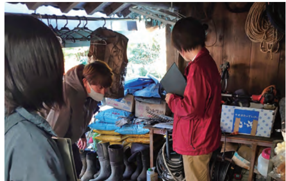
図1 外部アドバイザーとともに作業場のリスク検討を行う様子

その結果、令和5年1月27日付で、れんこんでは全国2番目のJGAP団体認証（7農場）を取得することができました。