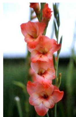
図1 グラジオラス「常陸あけぼの」の育成経過と開花様相