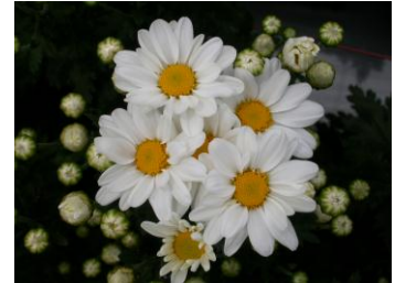
「常陸サマーシルキー」の開花状況