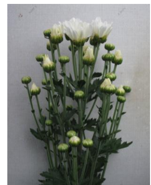
「常陸サマーシルキー」草姿