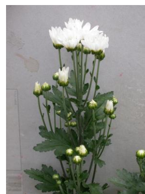
「常陸サニーバニラ」草姿