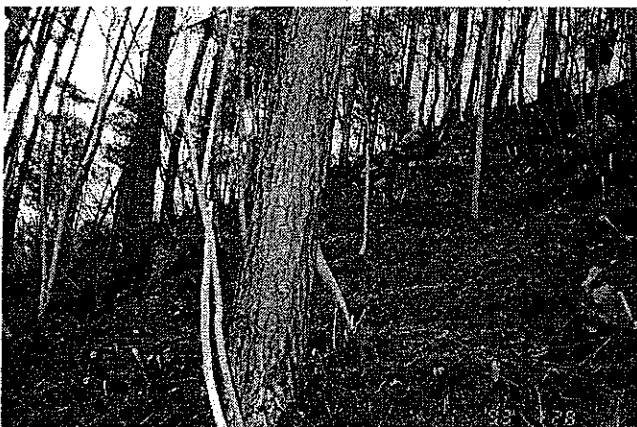
写真-2 環境改善後の状況