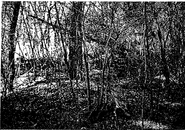
写真-1 環境改善前の状況

写真-1に環境改善前、写真-2に改善後の状況を示します。やぶに近い状態であった林が、広葉樹の整理により、明るくなったのが分かります。写真-2のような環境を保ちながら、9~11月にマツタケの発生本数を調査しました。