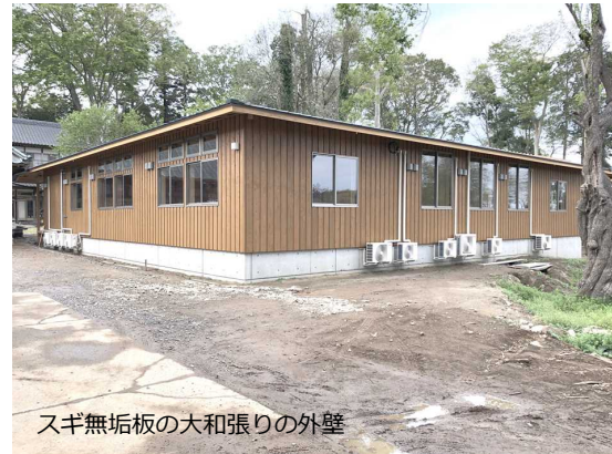
スギ無垢板の大和張りの外壁