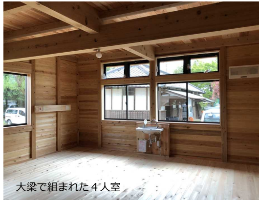
大梁で組まれた4人室