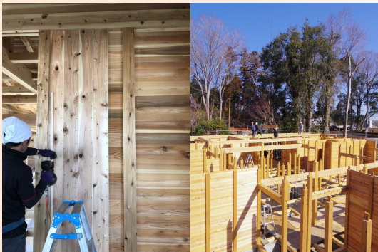
▲左：落とし板壁施工 右：建て方の様子