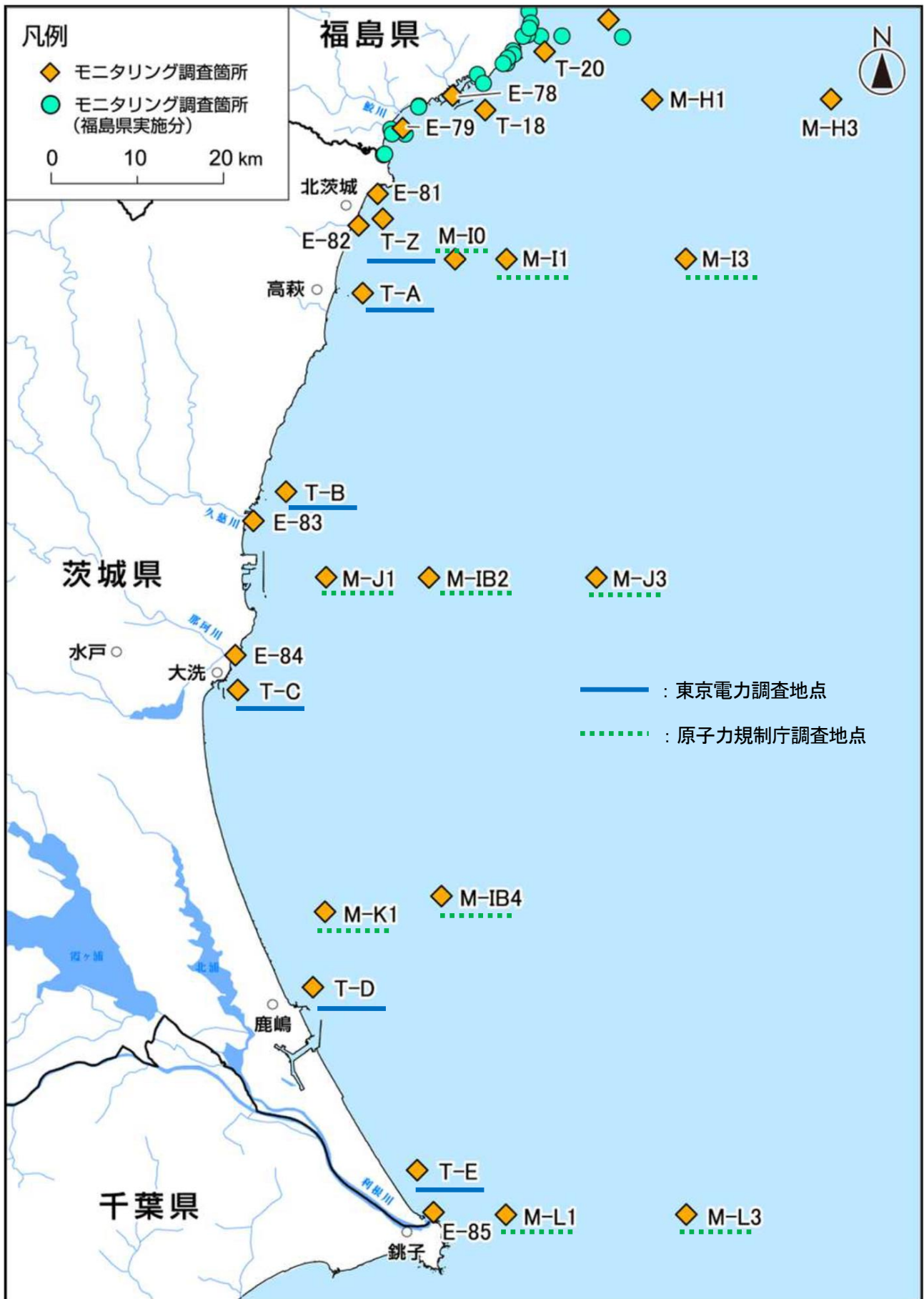
図Ⅱ-2 茨城県沖合の海域モニタリング地点 (平成28年度海域モニタリングの進め方)