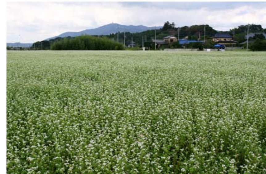
土浦市沢辺の蕎麦畑