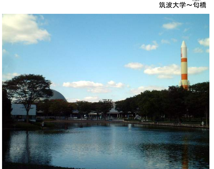
つくばエキスポセンター

関東ふれあいの道は、首都圏に残された美しい自然や歴史文化遺産などを「みち」で結び、首都圏を一周する長距離自然歩道です。茨城県内のルートは、常陸大宮市から御前山、笠間県立自然公園、水郷筑波国定公園や筑波研究学園都市を経て稲敷市へ至る18コース(延長約255km)により構成されています。家族や友人と一緒に歩いてみませんか。