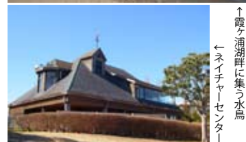
↑霞ヶ浦湖畔に集う水鳥 ←ネイチャーセンター