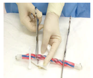
さいたいくん-臍帯切断 用シミュレーションキット-