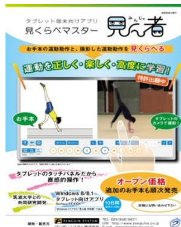
見ん者 (スポーツ・体育向けソフトウェア)

ペンギンシステム株式会社 つくば市千現二丁目1番地 6つくば研究支援センター CB10 :029(846)6671