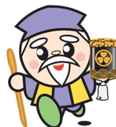
茨城県マスコットキャラクター ハッスル黄門

TEL.029-301-2966 TEL.029-301-3044 TEL.0294-80-3355 TEL.0291-33-6056 TEL.029-822-7048 TEL.0296-24-9134