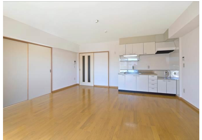
リビング・ダイニング（2LDK）