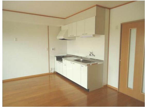
リビング・ダイニング（2LDK）