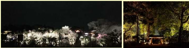
ライトアップ(南崖)