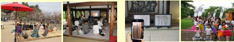
野点茶会 歴史体験！