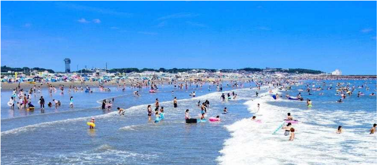
▲大洗サンビーチ海水浴場

7月16日(土)より海開き！ ※大洗サンビーチ海水浴場（大洗町）は7月23日(土)より解禁します。