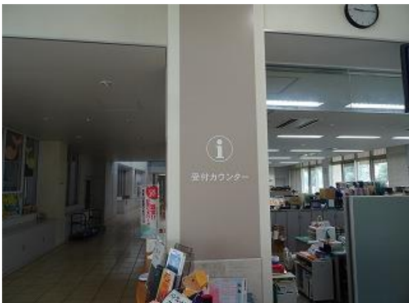
■2 受付カウンター1階 多言語化（日・英・中・韓）