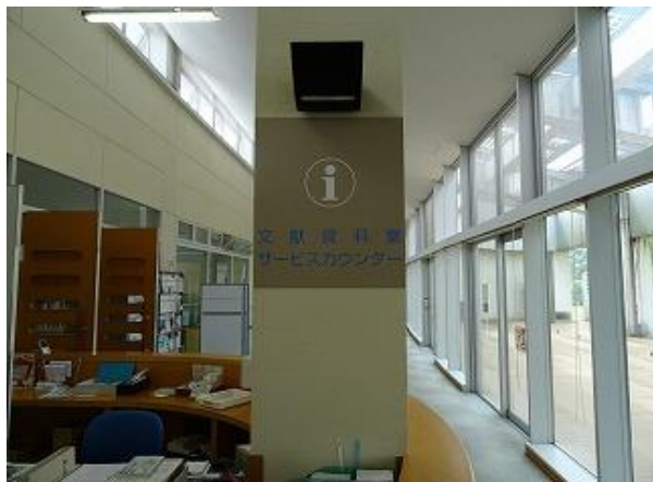
■9 | 文献資料室① 多言語化 (日・英・中・韓)