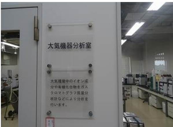
▲13 実験室（大気機器分析室） 多言語化（日・英・中・韓）