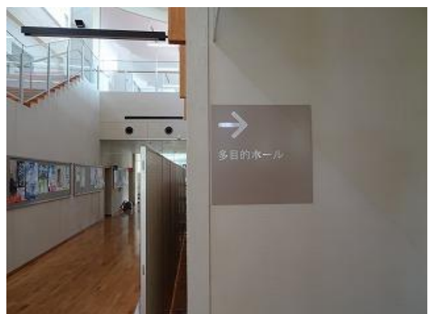
■5 誘導サイン（多目的ホール②） 多言語化（日・英・中・韓）