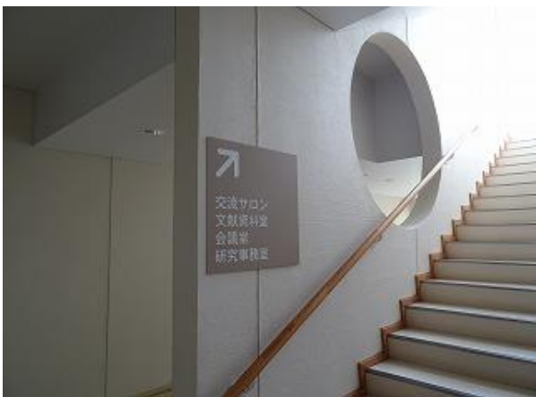
■13 | 誘導サイン (研究室②) 多言語化 (日・英・中・韓)