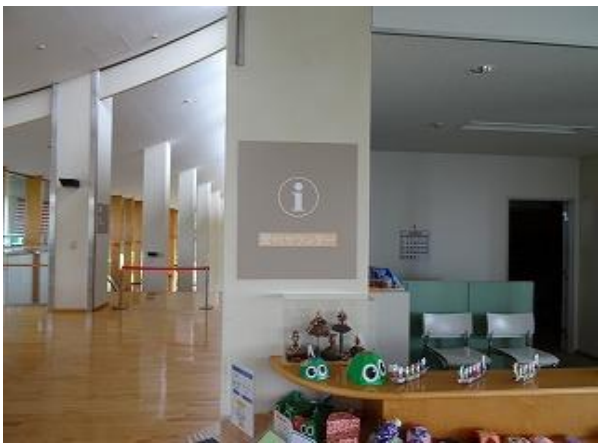
■8 | 受付カウンター2階 多言語化 (日・英・中・韓)