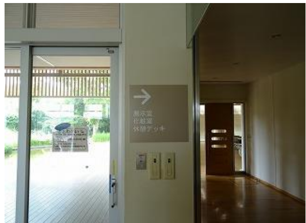
■3 誘導サイン（エントランス） 多言語化（日・英・中・韓）