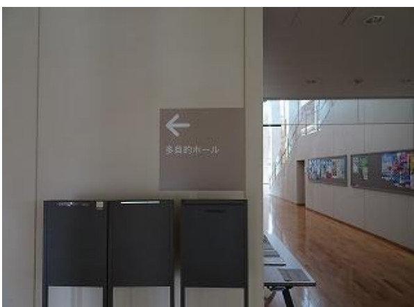
■4 誘導サイン（多目的ホール①） 多言語化（日・英・中・韓）