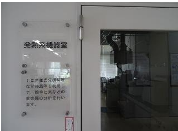
▲9 実験室（発熱系機器室） 多言語化（日・英・中・韓）