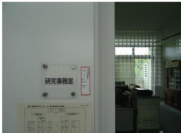
●16 室名 (研究事務室②) ●17 室名 (低温室) 多言語化 (日・英・中・韓) 多言語化 (日・英・中・韓)