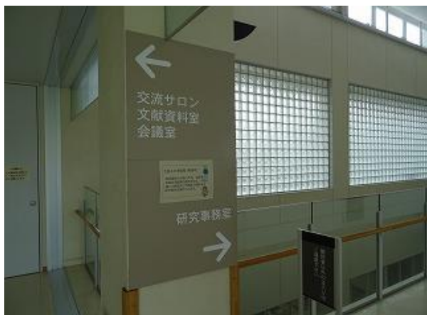
■11, 12 | 誘導サイン (研究室①) 多言語化 (日・英・中・韓)