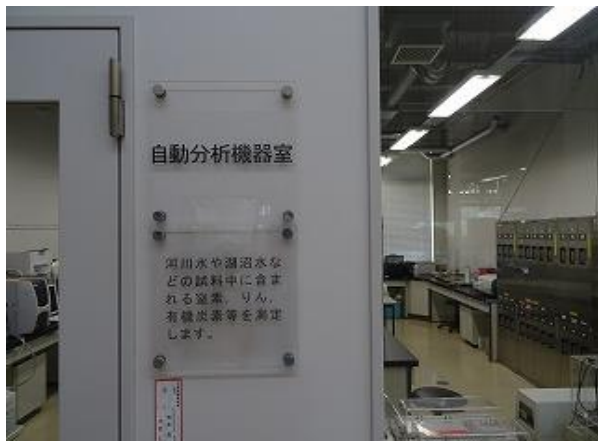
▲10 実験室（自動分析機器室） 多言語化（日・英・中・韓）