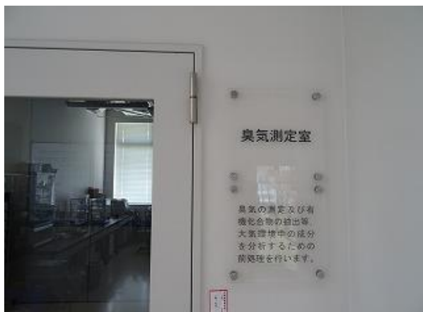
▲12 実験室（臭気測定室） 多言語化（日・英・中・韓）