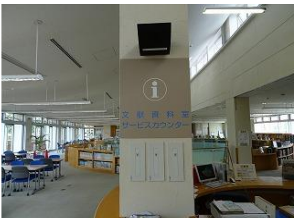
■10 | 文献資料室② 多言語化 (日・英・中・韓)