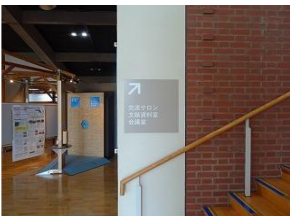
■6 誘導サイン（展示室） 多言語化（日・英・中・韓）