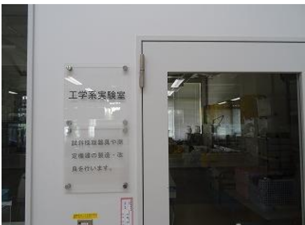
▲11 実験室（工学系実験室） 多言語化（日・英・中・韓）