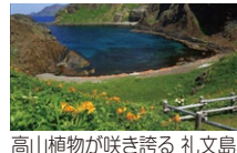
高山植物が咲き誇る礼文島

茨城空港は、国内線が札幌・神戸・福岡・那覇の4都市、国際線が上海・ソウル・台北の3都市に就航しています。また、6月には「利尻・女満別」、7月には「稚内」へのチャーター便が運航されます。美しい花々が咲き誇る利尻島・礼文島や世界自然遺産である知床半島の絶景などが楽しめる、初夏の北海道へぜひお出掛けください。