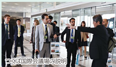
つくば国際会議場の説明

会合参加国の在京大使館職員に対し、本会合の会場(つくば国際会議場)や宿泊施設を案内する説明会を実施し、現地状況の理解を深めてもらいました。