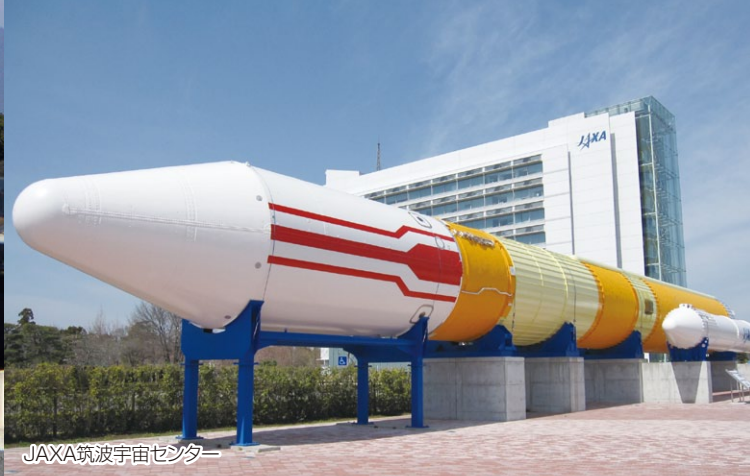
JAXA筑波宇宙センター