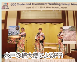
水戸の梅大使によるPR

各国の実務者を対象とした会合が県都水戸で開催された際に、日本文化の披露や水戸の梅大使によるPRなどを実施しました。