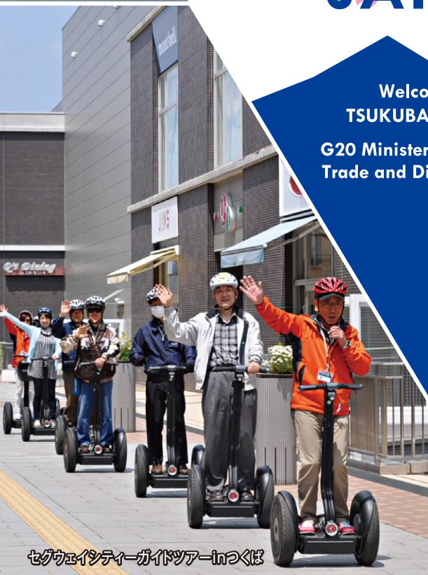
セグウェイシティーガイドツアーinつくば

Welcome to TSUKUBA, IBARAKI G20 Ministerial Meeting on Trade and Digital Economy