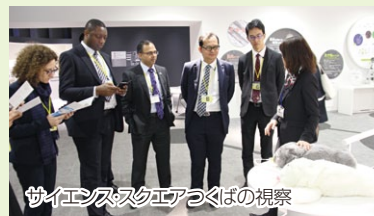
サイエンススクエアつくばの視察

会合参加国の在京大使館職員に対し、つくばの研究施設などを紹介するツアーを実施し、本県が誇る最新技術を体験してもらいました。