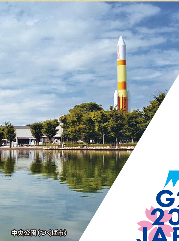
中央公園(つくば市)