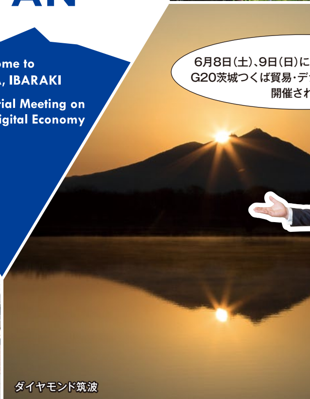
ダイヤモンド筑波

G20茨城つくば貿易・ デジタル経済大臣会合 5月のいばらきレッスンエンジョイ!