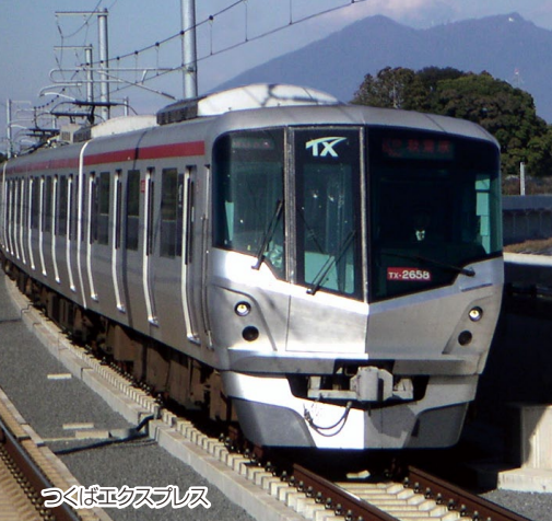
つくばエクスプレス