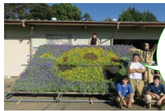
グリーンテクノ系列で園芸を学んでいる県立江戸崎総合高校の生徒が、去年9月に試作した飾花

高校で学んでいる草花の栽培方法・技術の知識を生かし、ピオラを4,400苗育てる予定です。飾花を見た方が、笑顔で元気になるような作品を、仲間と力を合わせて頑張ってください!