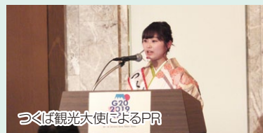
つくば観光大使によるPR

各国の実務者を対象とした会合で、県産食材を使用したメニューの提案やつくば観光大使によるPRなどを実施しました。