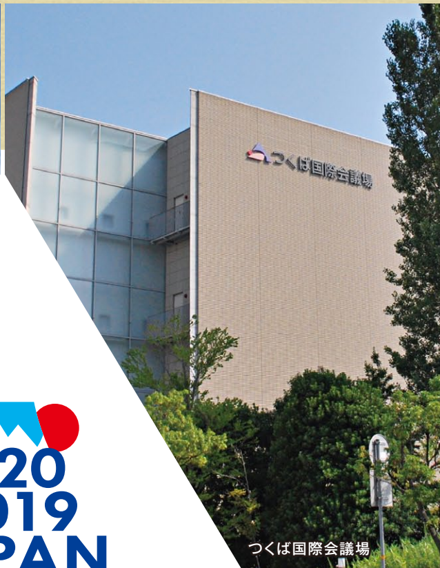
つくば国際会議場