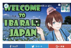
▲動画は「いばキラTV 茨ひより 英語DE観光案内編」で検索

私も動画で、世界に向けて茨城の魅力を発信しています。皆さんのお勧めの「茨城」は何ですか?一緒に「茨城」を世界に発信していきましょう😊