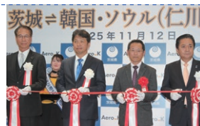
茨城-ソウル(仁川)路線就航記念セレモニーの様子