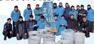
常陸乃国まさば 養殖関係者

多くの方と手探りで取り組みを積み重ね、胸を張れる養殖魚になりました。ぜひ味わってみてください。