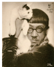
ドラ・カルムス(マダムドラ) 《猫を肩にのせる藤田嗣治》 1927年 東京藝術大学

エコール・ド・パリを代表する画家・藤田嗣治(1886-1968)。早くからカメラを愛用していた藤田は数千点の写真を撮影するとともに、絵画制作にも活用しました。また、藤田はオカッパ頭や眼鏡など独特の風貌によって自己のイメージを演出し、しばしば著名な写真家の被写体にもなりました。「写真」をキーワードに、新たな藤田像に迫ります。