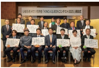
昨年のコンテストの様子