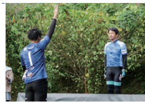
昨年度開催した「Okukuji X」開会式において、力強い選手宣誓を受けました