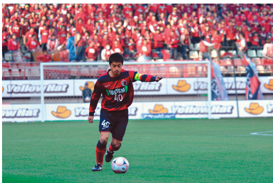
※時間はすべて試合開始の時間です。