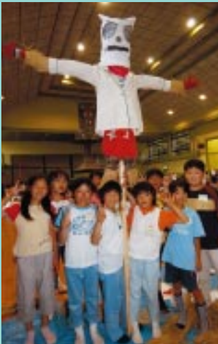
「見て！見て！立派なかかしでしょ」