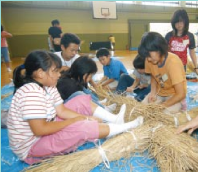
かかし作りに挑戦。「自分たちで作るお米は自分たちで守るよ」と真剣な表情の子もたち

水戸市の西端にあり、山林や水田などに囲まれた自然豊かな環境にあります。近くには水戸市森林公園などもあり、ウォークラリーやハイキングなど野外活動にも最適です。キャンプファイヤーや天体観察、ホタル観察などさまざまな活動に利用できます。