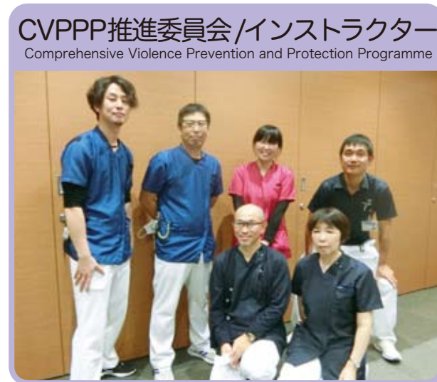
CVPPP推進委員会/インストラクター Comprehensive Violence Prevention and Protection Programme