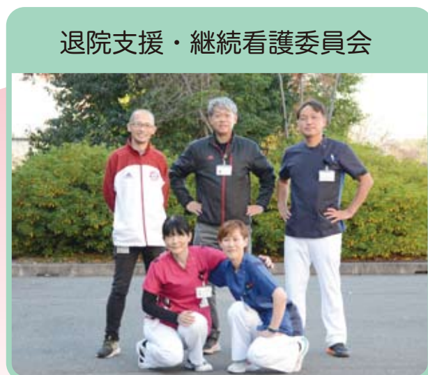
退院支援・継続看護委員会