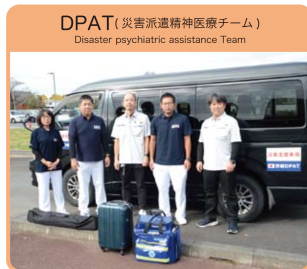
DPAT (災害派遣精神医療チーム) Disaster psychiatric assistance Team