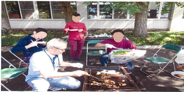
美味しいところを お先に！！ ごちそう様

9：30頃から準備して 11：30頃から食べました 14：00頃 かき氷食べました