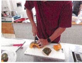
あまーい カボチャ でした