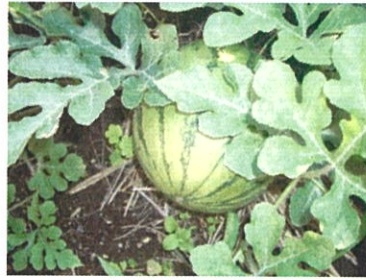
これは昨年の収穫のスイカです