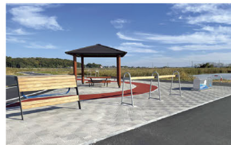
ポケットパークつちうら

サイクリングの出発地点となる主要アクセスポイント(鉄道駅、道の駅等)やルート沿線の各地点において、サイクリストが快適で安心してサイクリングを楽しむことができるよう、休憩施設等の整備を推進していきます。