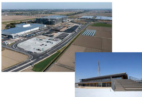
▲周辺民間施設と連携した新たなまちづくりの拠点(常総)