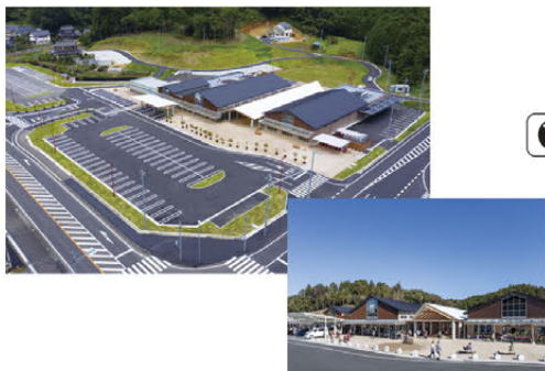
▲駐車場など休憩施設の整備(かさま)

また、道の駅の整備・運営主体である市町村に対し、助言や情報提供等の支援を行っています。