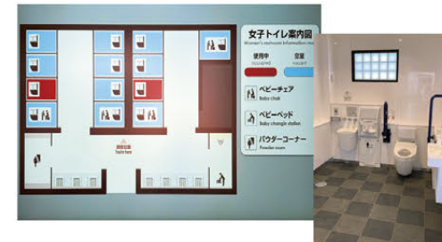
▲トイレの空きナビやバリアフリーなど利用者に配慮した施設(しもつま)