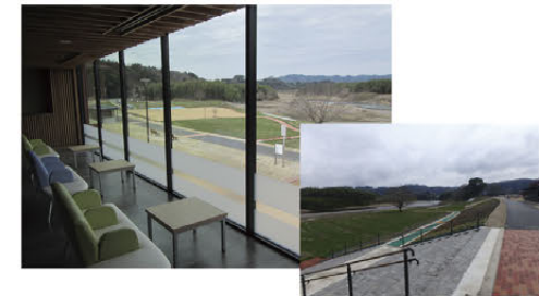
▲隣接する河川への眺望を活かした親水空間の整備(常陸大宮)