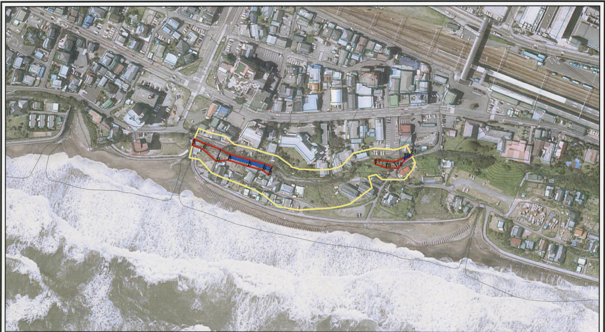
図中の数字は横断測線番号を示す