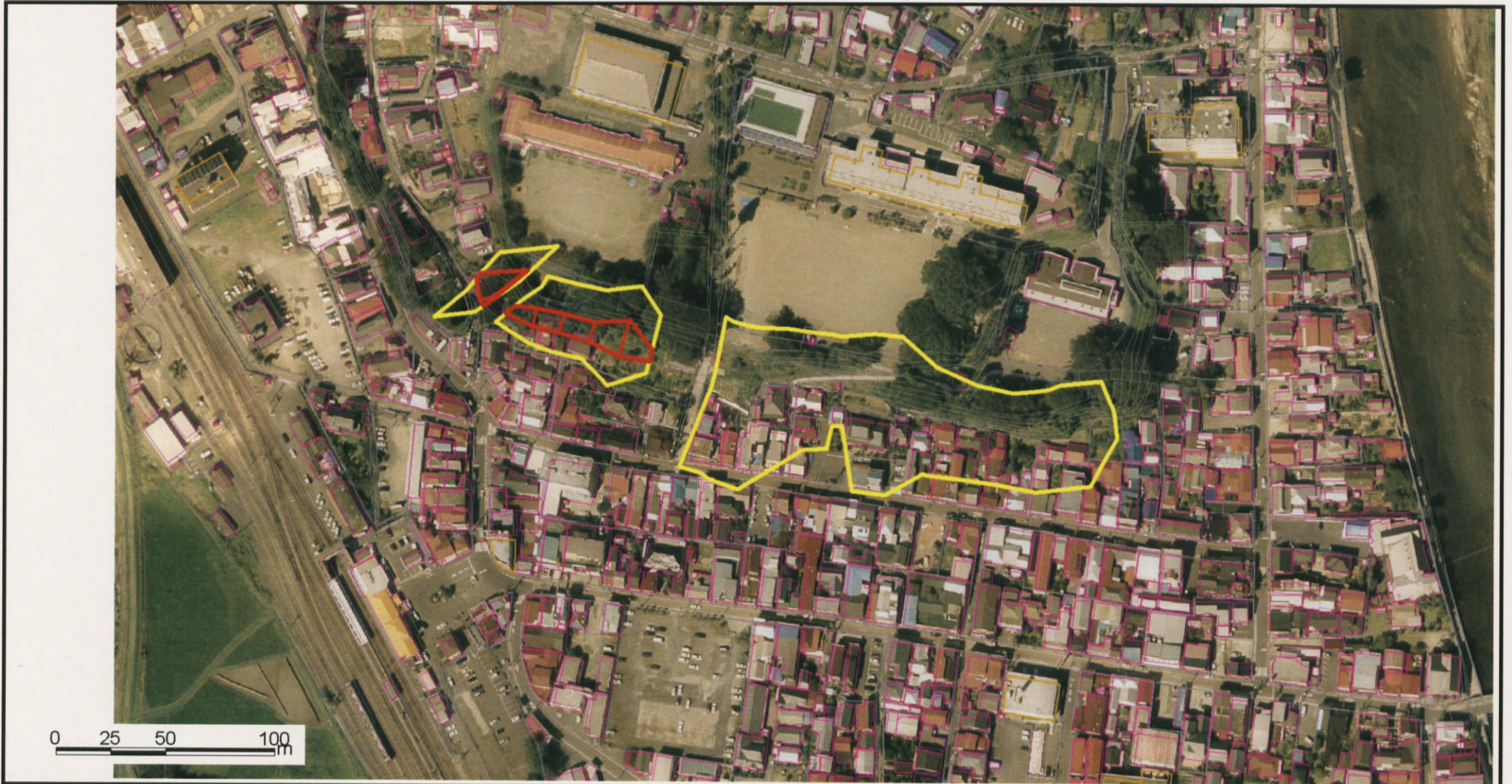
様式-3(急) 土砂災害警戒区域・土砂災害特別区域 区域図(その1)