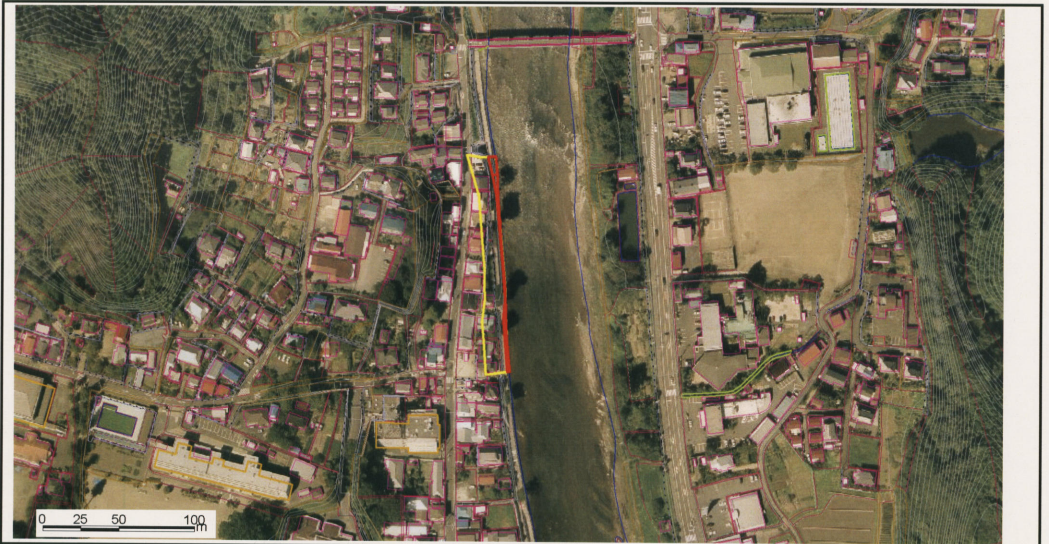
様式-3(急) 土砂災害警戒区域・土砂災害特別区域 区域図(その1)