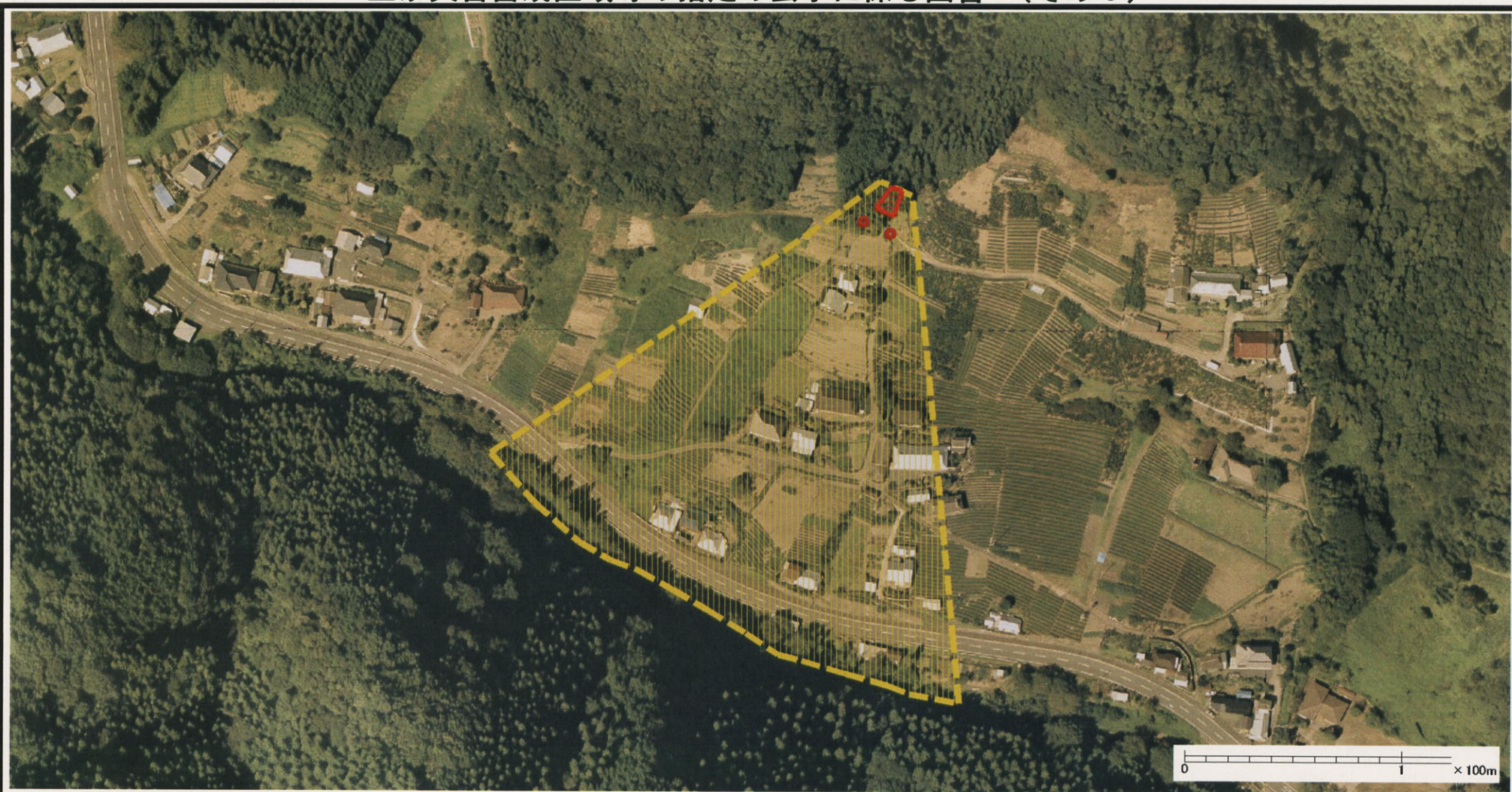
様式-3 (土) 土砂災害警戒区域・土砂災害特別警戒区域 区分図 (その2)