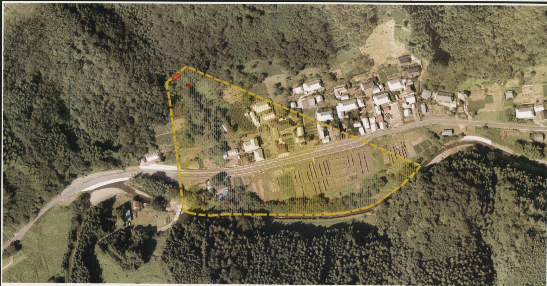
様式-3 (土) 土砂災害警戒区域・土砂災害特別警戒区域 区分図 (その2)