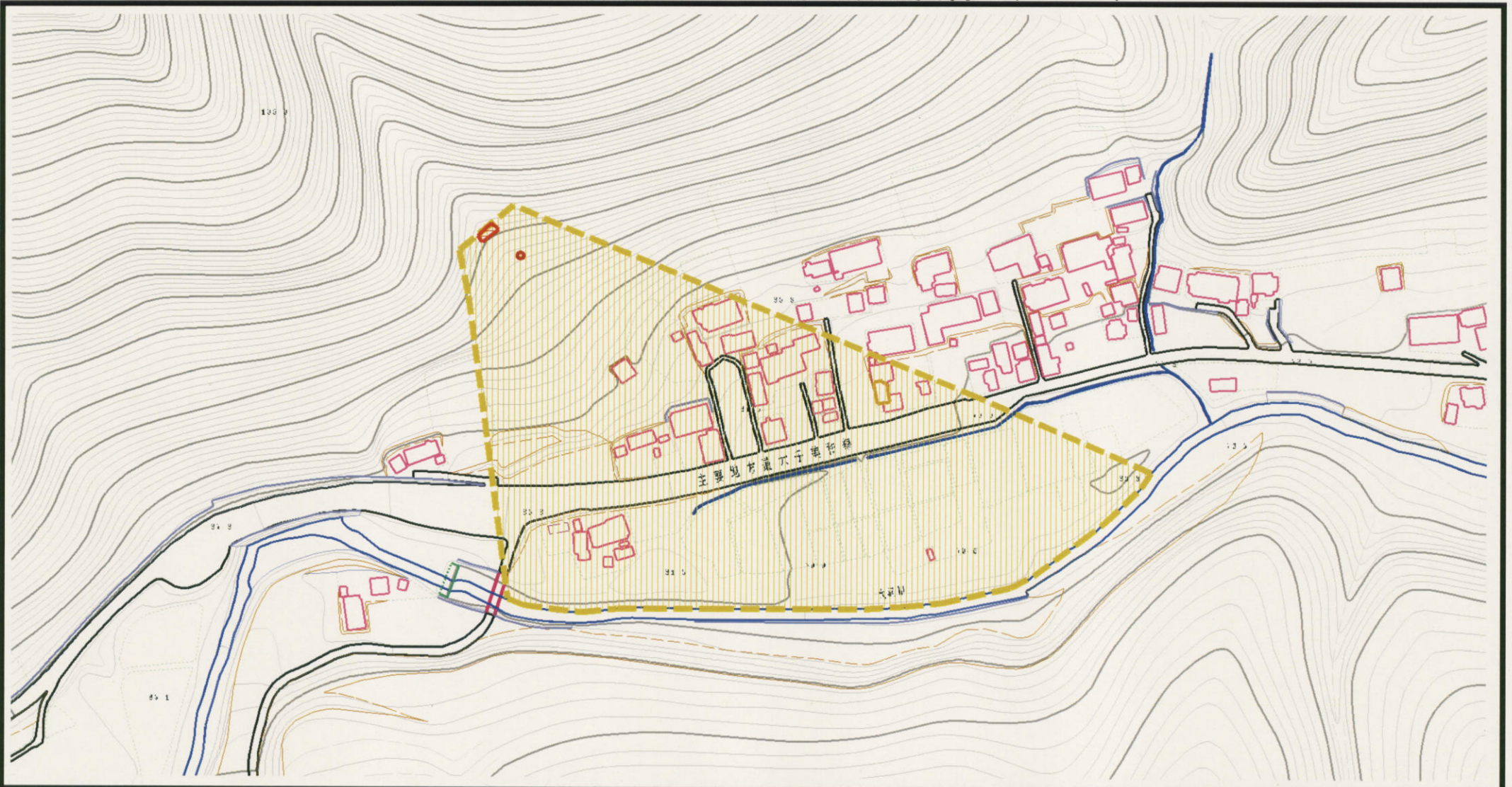
様式-2 (土) 土砂災害警戒区域・土砂災害特別警戒区域 区分図 (その1)