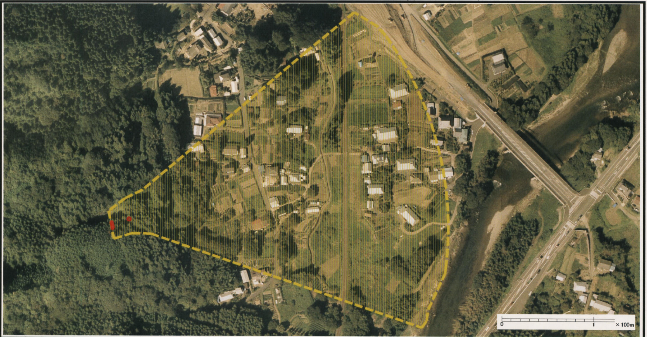
様式-3 (土) 土砂災害警戒区域・土砂災害特別警戒区域 区分図 (その2)