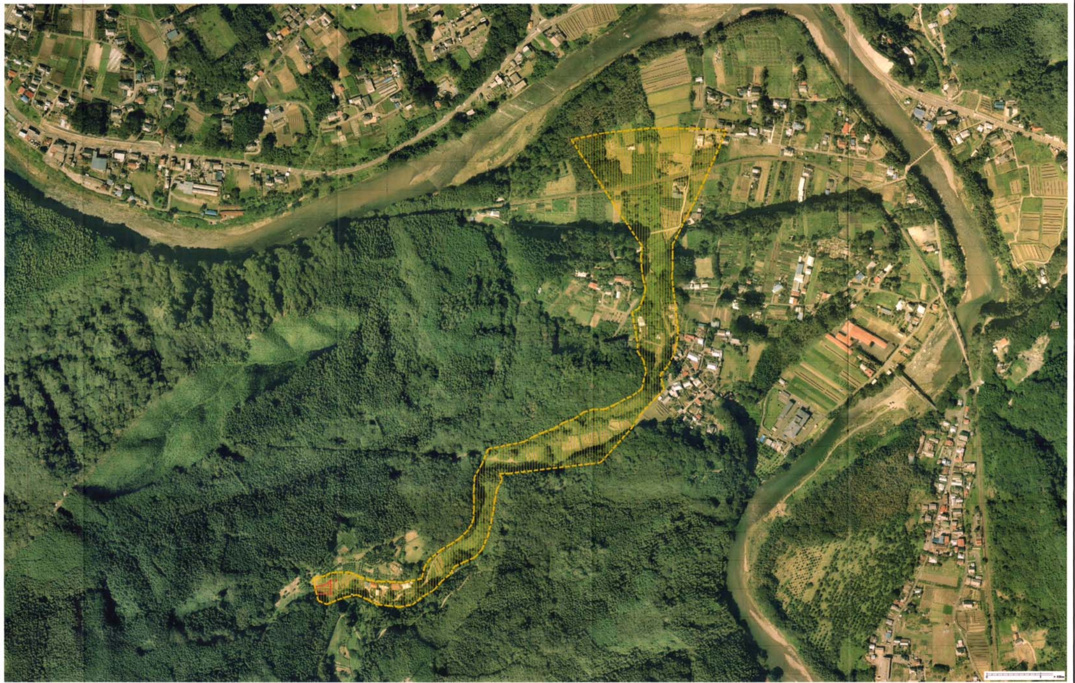
様式-3（土） 土砂災害警戒区域・土砂災害特別警戒区域 区分図（その3）