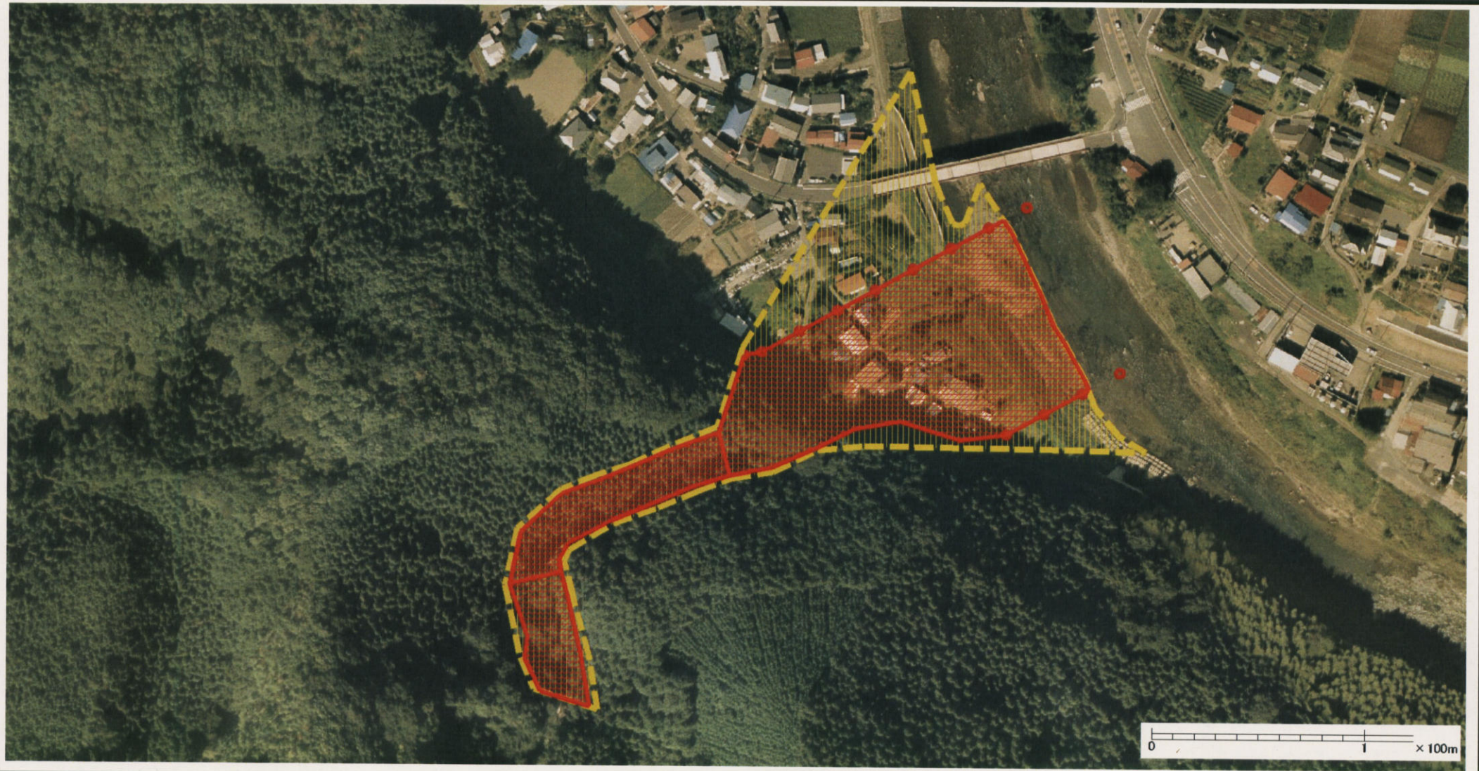
様式-3 (土) 土砂災害警戒区域・土砂災害特別警戒区域 区分図 (その2)