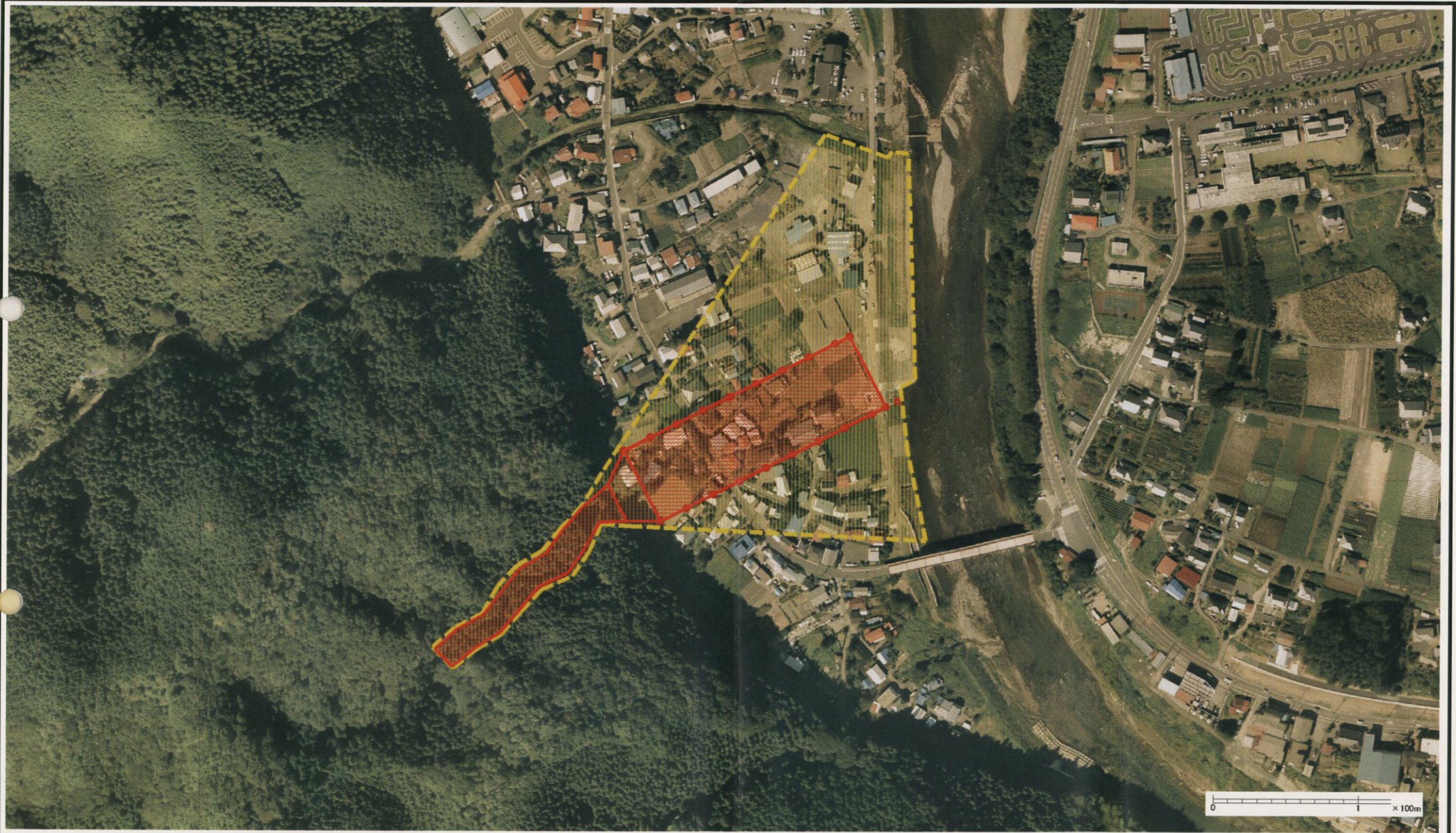
様式-3(土) 土砂災害警戒区域・土砂災害特別警戒区域 区分図(その3)