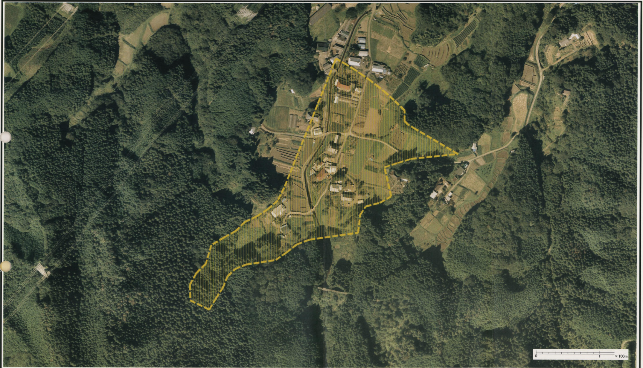
様式-3 (土) 土砂災害警戒区域・土砂災害特別警戒区域 区分図 (その3)