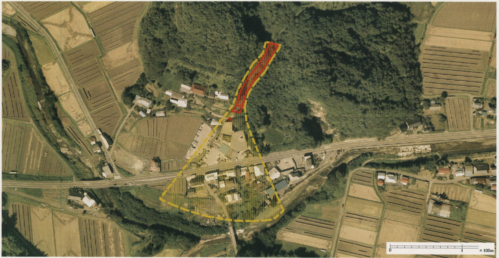
様式-3 (土) 土砂災害警戒区域・土砂災害特別警戒区域 区分図 (その2)