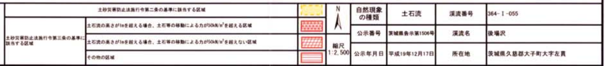
様式-3 (土) 土砂災害警戒区域・土砂災害特別警戒区域 区分図 (その3)